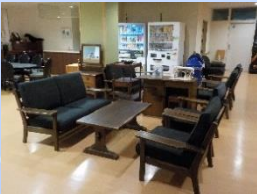
2階多床室EV前のソファー