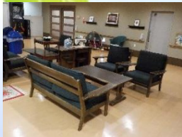
1階ロビーの共有面会スペース